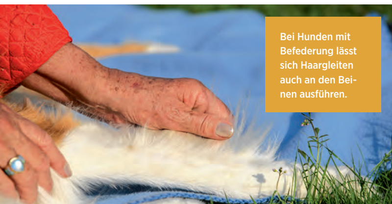
Bei Hunden mit Befederung lässt sich Haargleiten auch an den Beinen ausführen.

diesem Fall den Säugling, richten, sondern auch andere Familienmitglieder und fremde Artgenossen betreffen können. Mangelnde Zuneigungsbekundungen vermögen Aggressionen auszulösen und das muss unter allen Umständen verhindert werden. Wer möchte schon, dass Menschen gebissen oder ahnungslose Vierbeiner in Raufereien verwickelt werden?