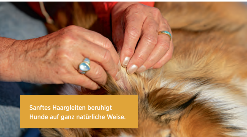
Sanftes Haargleiten beruhigt Hunde auf ganz natürliche Weise.